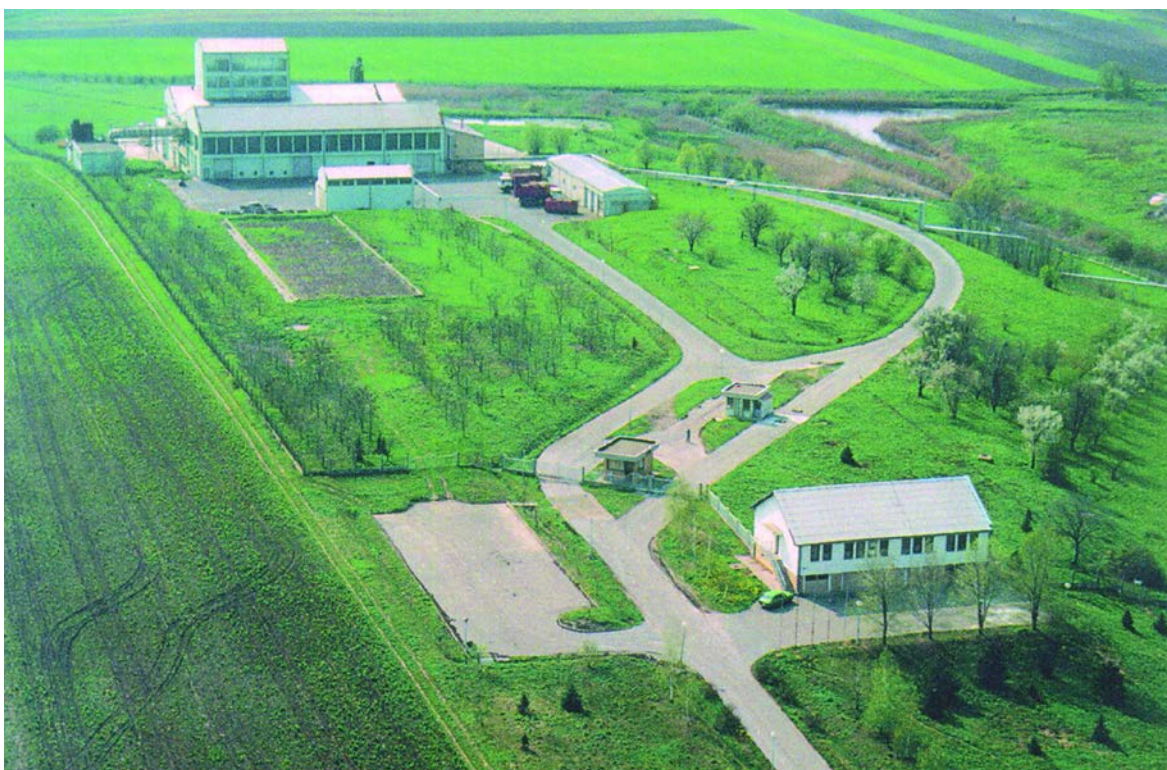
Slika 1. AIK „Bačka Topola“ trgovinskog preduzeća

Tokom 2000. godine izvršena je vlasnička transformacija i deoničko društvo prelazi u akcionarsko sa 91,18 % i 8,82 % društvenog kapitala odnosno vlasništvo akcijskog fonda. Godine 2005. godine otkupom akcija na berzi zaposleni radnici AIK-a Bačka Topola su stekli pravo upravljanje nad preko 65% glasova u skupštini akcionara .